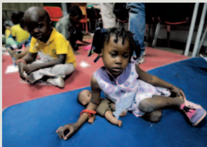
EN 2010, l'année du tremblement de terre en Haïti, 11 enfants de ce pays ont été confiés en adoption en Belgique.

Le nombre d'adoptions internationales est en baisse en Wallonie et à Bruxelles. Un phénomène amorcé depuis 2004 qui touche la plupart des pays européens. Ainsi, en 2010, sur 226 enfants adoptés côté francophone, 183 venaient de l'étranger ; ils étaient 195 sur 221 l'année précédente (2009).