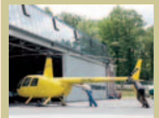
SPADEL voudrait qu'on interdise les vols au-dessus de sa zone de captage de l'eau.

Difficile cohabitation entre eau de Spa et avions