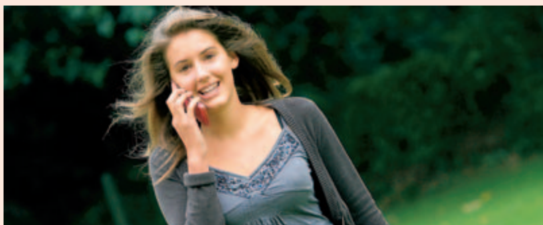
LES COÛTS de terminaison facturés par les opérateurs sont excessifs, dit l'IBPT.

Pourquoi cette asymétrie dans les tarifs ? Parce que le poids des trois opérateurs sur le marché n'est pas le même et que le régulateur des télécoms, l'IBPT (l'Institut belge des services postaux et des télécommunications) tient compte de la position des uns et des autres dans la fixation