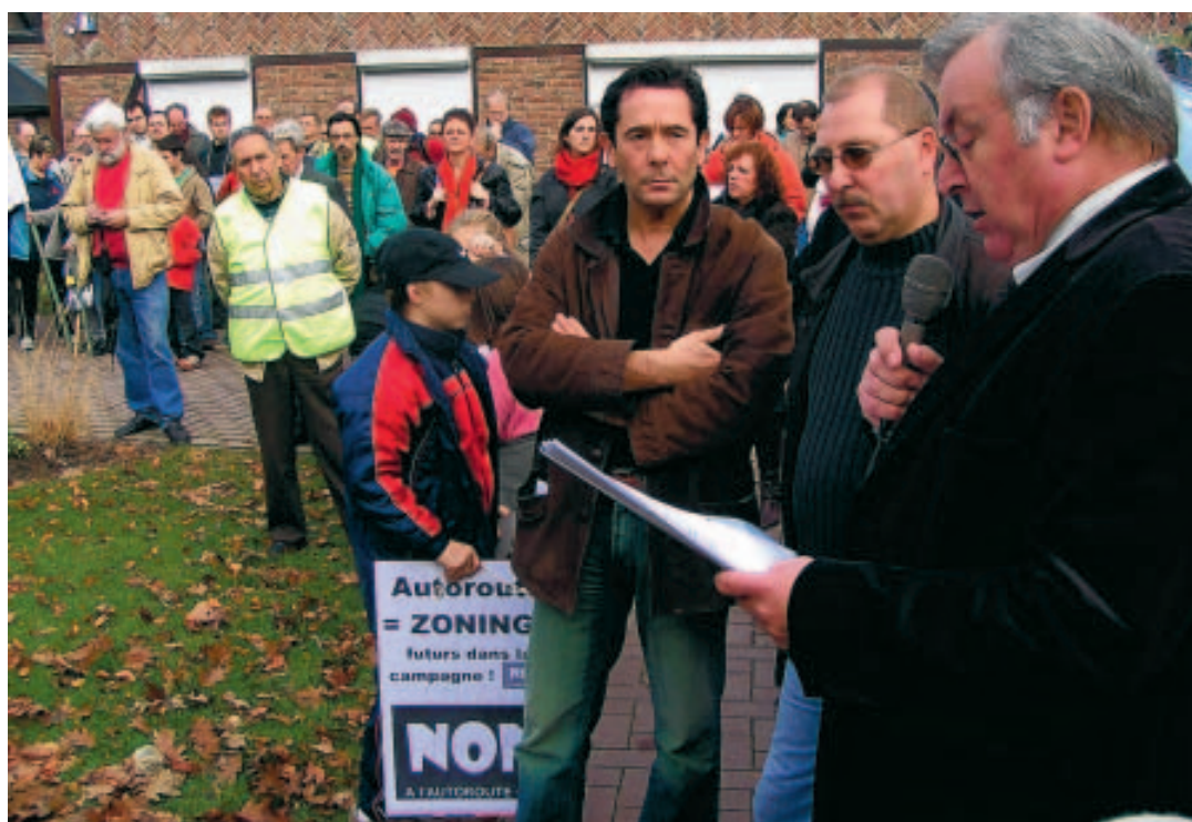
Les opposants sont-ils représentatifs de l'avis général? pas selon le sondage...

> 13 % des interrogés seulement savent qu'il est prévu d'implanter une liaison RAVel (parcours cycliste) tout le long de la liaison.