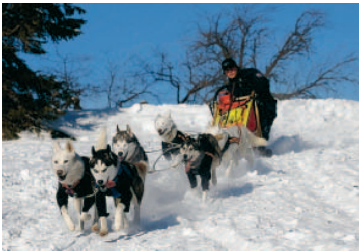
Les chiens de traîneaux à Saint-Vith le week-end prochain.

"Avec près de 10.000 visiteurs, nous avons enregistré un très bon week-end, surtout dimanche, fantastique lorsque le soleil a été rendez-vous", se réjouit Sandra De Taeye, direction de l'Office du tourisme des Cantons de l'Est. Près de 4.500 paires de skis, de raquettes et des luges ont été louées. Depuis